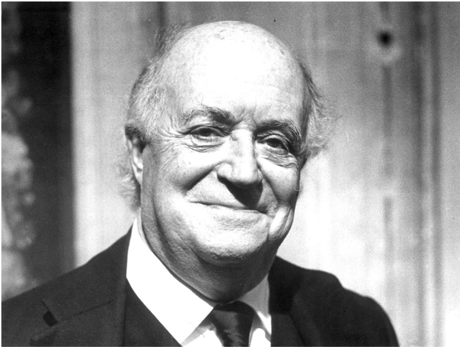
Ramon Aramon i Serra. Premi d'Honor de les Lletres Catalanes (1983).