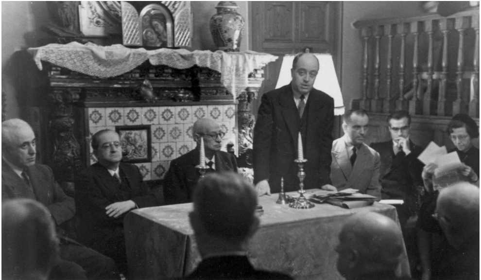
Acte de lliurament de la Miscel·lània Puig i Cadafalch al domicili de Lluís Bonet i Garí cap a 1953.