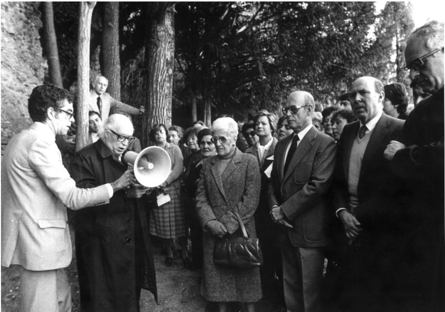
Festes Populars de Cultura Pompeu Fabra, Montserrat 1980.