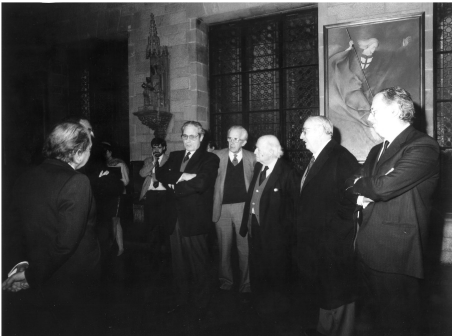
Acte de signatura del conveni de col·laboració entre la Generalitat de Catalunya i l'Institut d'Estudis Catalans. Palau de la Generalitat (1988).