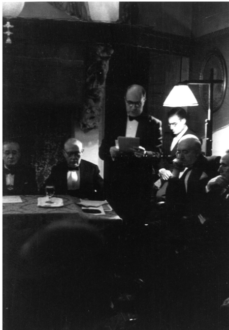
Festa de Sant Jordi de l'Institut d'Estudis Catalans. Casa de Puig i Cadafalch (1947).